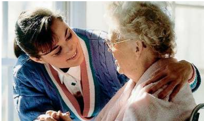
Con dolcezza. Alle badanti è chiesta la capacità di creare empatia