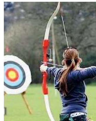
Arcieri. Tiro con l'arco